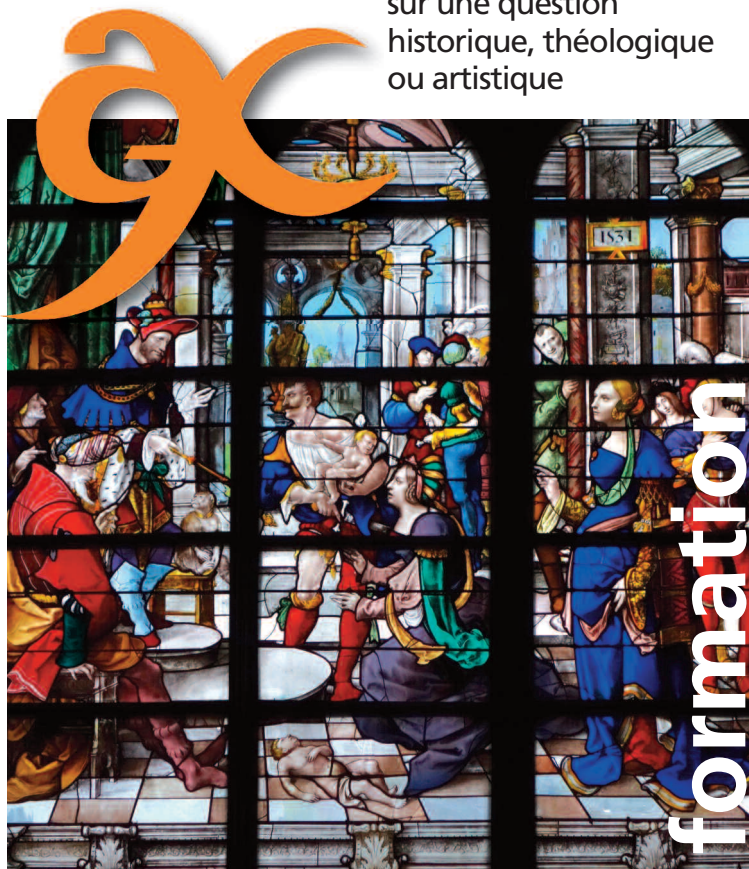
La Sagesse de Salomon, vitrail Renaissance de l'église Saint-Gervais Saint-Protais.