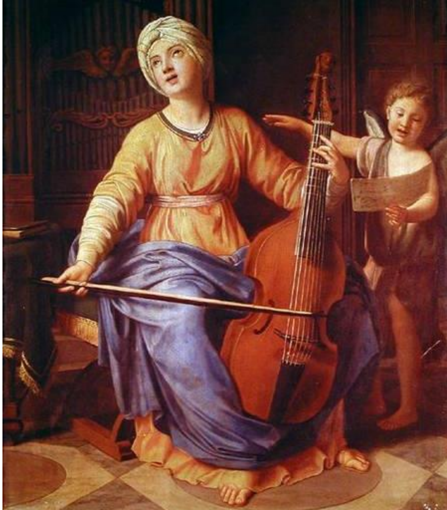
Nicolas Colombel (1644-1717) : Sainte Cécile jouant de la basse de viole