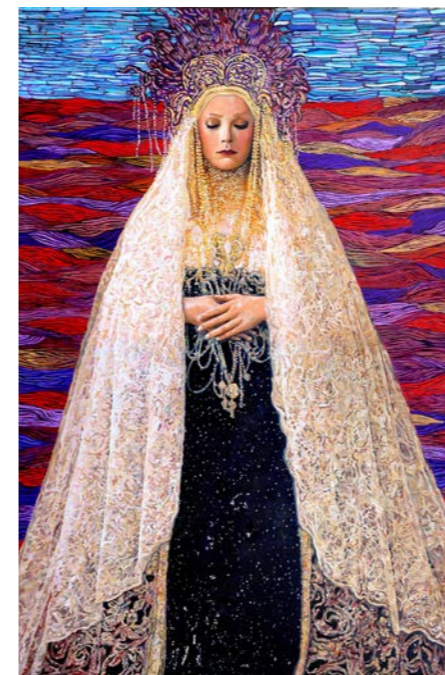
Sam AZULYS, Madone de la Terre , 2026 Huile sur toile, 180x120

Autour d'elle la mer gronde, les vagues se brisent. Ses larmes purifient les cœurs lourds de chagrin, elles nous lavent de nos péchés. Elle souffre avec nous, se tient près de ceux qui n'en peuvent plus, accueille toute la douleur du monde : la sienne et celle des autres.