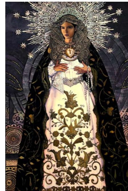
Sam AZULYS Santa Madre 4 , 2023 Technique mixte et résine époxy sur papier marouflé sur bois, 86,5 x 59,5 cm