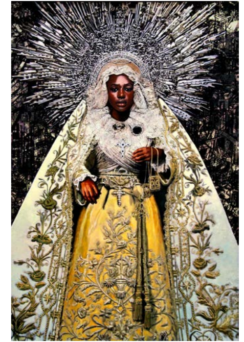
Sam AZULYS Santa Madre 3 , 2023 Technique mixte et résine époxy sur papier marouflé sur bois, 86,5 x 59,5 cm