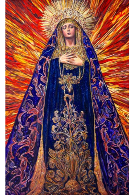
Sam AZULYS, Madone du Feu , 2026 Huile sur toile, 180x120

Quatre Madones se tiennent ici, pour veiller sur les quatre portes du monde.