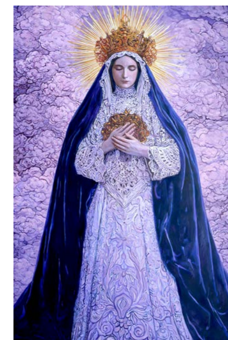
Sam AZULYS, Madone de l'Air , 2026 Huile sur toile, 180x120