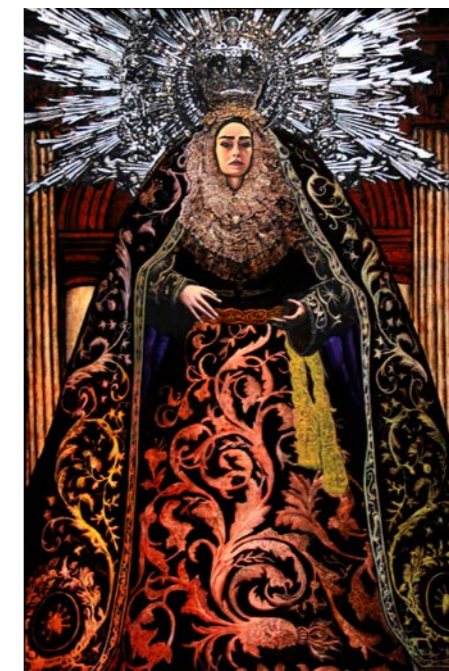
Sam AZULYS Santa Madre 5 , 2023 Technique mixte et résine époxy sur papier marouflé sur bois, 86,5 x 59,5 cm