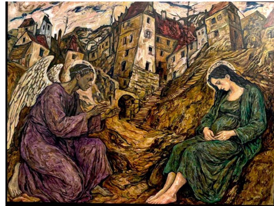
Sam AZULYS La Visite , 2026 Huile sur toile, 80x60cm

Le corps est allongé, vu en raccourci héritage assumé du Cristo morto de Mantegna. Mais là où Mantegna laissait Marie en pleureuse latérale, ici elle se penche par-dessus son fils, le visage tout près du sien. Entre la croix et le tombeau : ni deuil exposé, ni dévotion solennelle, mais une tendresse suspendue au seuil de ce qui va venir. Ce que la tradition picturale a donné au monde, la toile le rend à l'intime et au recueillement.