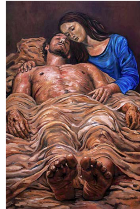
Sam AZULYS Pietà , 2026 Huile sur toile, 60x90cm

Entre elle et le Christ se joue une traversée de la chair : naissance invisible, mort exposée, lumière incarnée. Le sacré n'y descend pas hors du monde ; il travaille la matière même, dans le silence, la douleur et la couleur.