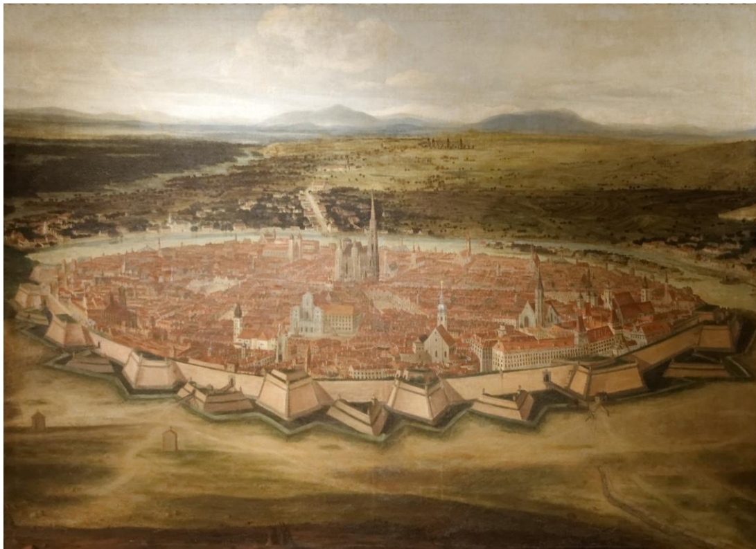
Vienne vers 1690