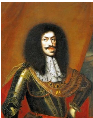
Léopold 1 er en 1672

Marc'Antonio Ziani (vers 1653-1715) est né à Venise, où il suit probablement l'enseignement de son oncle, le compositeur Pietro Andrea Ziani, qui dispose également de fortes connexions avec l'Autriche et l'Allemagne. Marc'Antonio partage son activité entre Mantoue et Venise, où il est, de 1679 à 1700, l'un des principaux compositeurs d'opéra. En avril 1700, il devient vice-maître de chapelle de l'empereur Léopold 1 er à Vienne. Il restera à Vienne jusqu'à sa mort, au service de Joseph 1 er puis de Charles VI. Son activité à Vienne consistait principalement à composer des opéras et des oratorios.