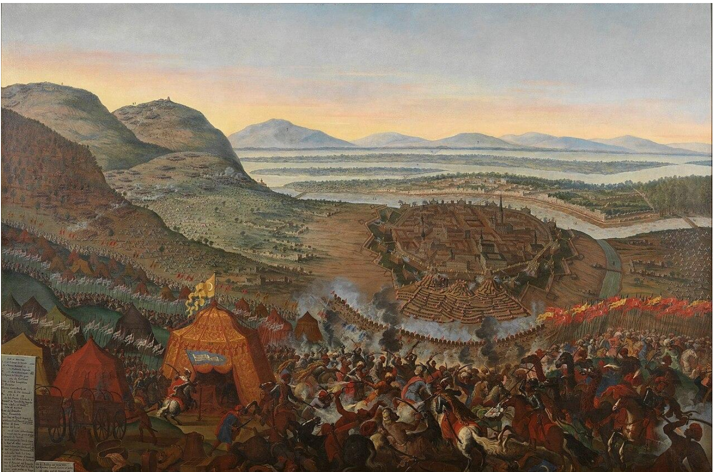
La bataille de libération de Vienne par Frans Geffels (1624-1694)

et autres pièces de Ahle, Froberger, Pederzuoli, Schmelzer, Ziani