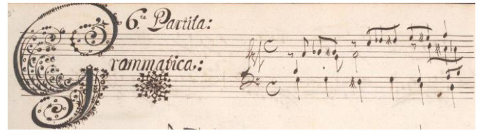
Débuts de la toccata prima et de la 6 ème variation sur « die Mayerin » de Froberger décorés par Johann Friedrich Sautter