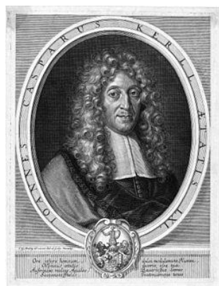
Kerll en 1680