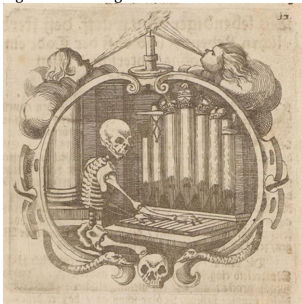
La Mort à l'orgue, gravure extraite de l'ouvrage d'Abraham a Sancta Clara « Merck's Wien » 1680

Une aide médicale est apportée par des ecclésiastiques et des médecins. Les médecins étaient surnommés « médecins à bec » car ils portaient de longues robes cirées, des gants et leur visage était protégé par un masque muni d'une protubérance en forme de bec de canard qui contenait des herbes et essences censées les protéger de la contagion.